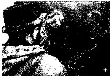
Un visitante observa el 'Velatorio' de López Mezquita.

A primera vista parece una suerte de portal de Belén flamenco, con los gitanos extasiados bailando y cantando con un niño recién nacido en el centro, en su cuna. Después, con una observación más detenida, el espectador sobrecogido se da cuenta de que está observando a un bebé en su ataúd en las zambras del Sacromonte. Es Velatorio , el inquietante cuadro de José María López Mezquita, realizado en 1910, que presentó ayer el Museo de Bellas Artes de Granada. El lienzo fue la última adquisición del Ministerio de Cultura del Gobierno de Rodríguez Zapatero y pasa ahora a engrosar la colección de artistas granadinos del museo del Palacio de Carlos V. El Velatorio de López Mezquita es una vieja aspiración del director del museo, Ricardo Tenorio, quien durante una pasada exposición en Granada preguntó al anterior propietario sus intenciones sobre el cuadro. Este le respondió que no pensaba venderlo. "Cuál fue mi sorpresa cuando supe que estaba destinado a venderse en el extranjero", resaltó Tenorio en la presentación. "Es un cuadro de museo porque nadie compra una obra de arte como esta para ponerla en el salón de su casa", continuó el director.